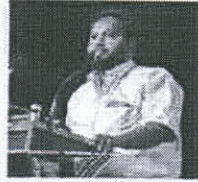
கவிஞர் மீன்கொடி பாண்டிய ராஜ்